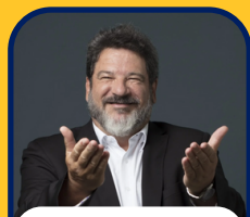
Mário Sergio Cortella